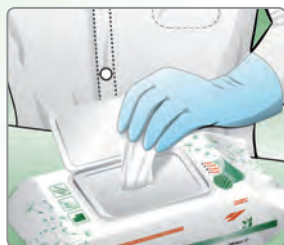
Quitar el precinto de inviolabilidad y sacar una toallita zeta 3 wipes POP-UP .

Limpiar minuciosamente la superficie con la toallita asegurándose de pasarla de modo uniforme y dejarla actuar.