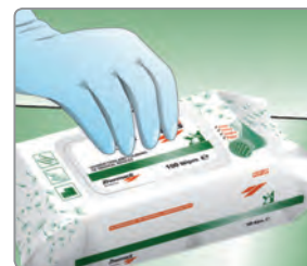
Volver a cerrar bien el envase.