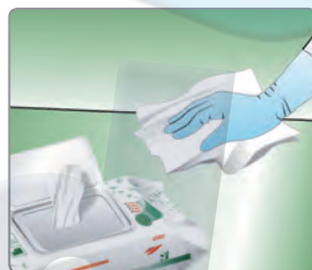
Frotar con la toallita la superficie a desinfectar.