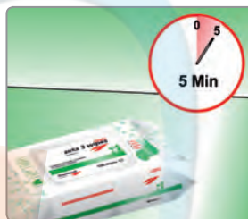
Dejar actuar como mínimo durante 5 minutos y dejar secar.