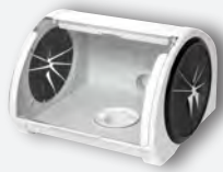
Caja de repaso clínica REF. 080534C