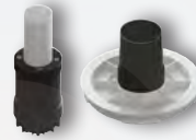
Base para brazo REF. 080536-11