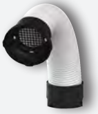
Tubo LED REF. 080534T