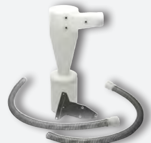
Decantador Ciclón REF. 080535