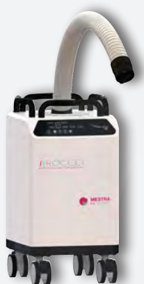
Sirocco M con tubo flexible REF. 080536A (filtro desechable pequeño) REF. 080536D1 (filtro reutilizable 4.3 l) REF. 080536D2 (filtro reutilizable 2.5 l)