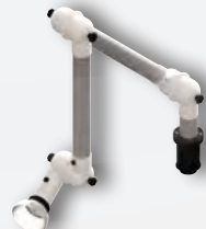
Brazo articulado REF. 080536-09