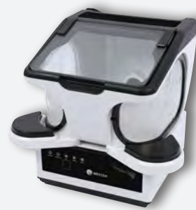
Sirocco S con caja de repaso para laboratorio REF. 080534AL