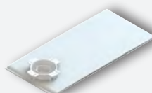
Filtro desechable grande REF. 080537-03