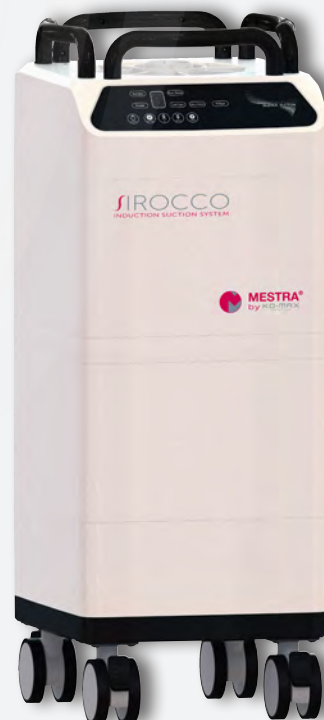
Aspiración Sirocco L REF. 080537

Interface CAM Cable • Filtrado Grado ULPA U15