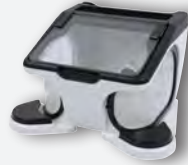
Caja de repaso laboratorio REF. 080534L