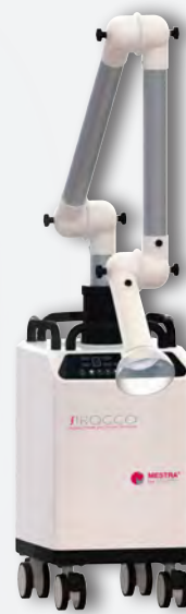
Sirocco M con brazo articulado REF. 080536C (filtro desechable pequeño) REF. 080536F1 (filtro reutilizable 4.3 l) REF. 080536F2 (filtro reutilizable 2.5 l)