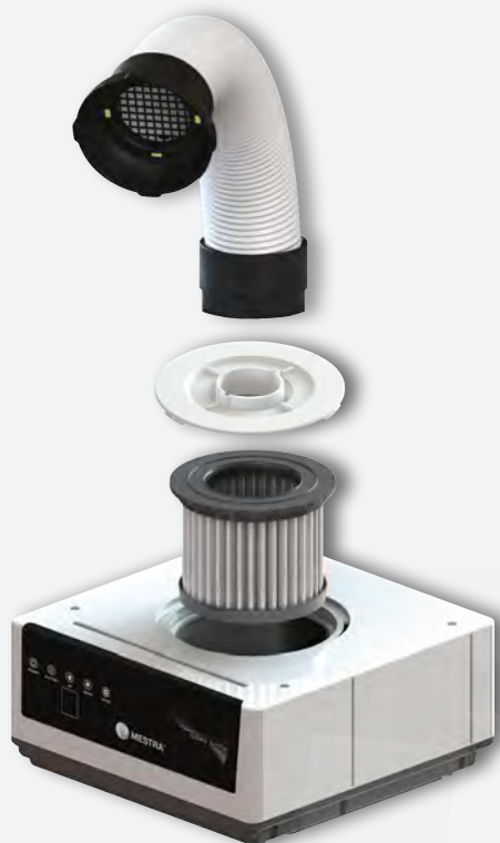
Aspiración Sirocco S REF. 080534

Aspiración especialmente indicada para entornos de clínica y válida también para laboratorio, que cuenta con el tamaño perfecto para un uso de sobremesa y una estética estilizada.