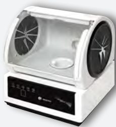
Sirocco S con caja de repaso para clínica REF. 080534AC