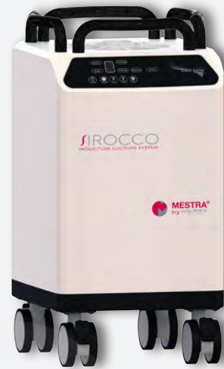
Aspiración Sirocco M REF. 080536