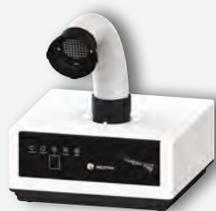
Sirocco S con tubo LED REF. 080534AT