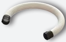
Tubo flexible REF. 080536-07