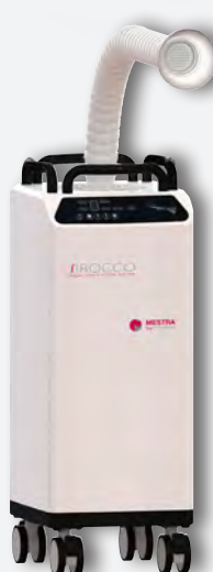
Sirocco L con brazo serpiente REF. 080537B (filtro desechable grande) REF. 080537E (filtro reutilizable 7.5 l)