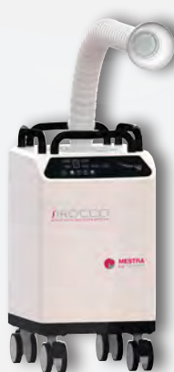
Sirocco M con brazo serpiente REF. 080536B (filtro desechable pequeño) REF. 080536E1 (filtro reutilizable 4.3 l) REF. 080536E2 (filtro reutilizable 2.5 l)