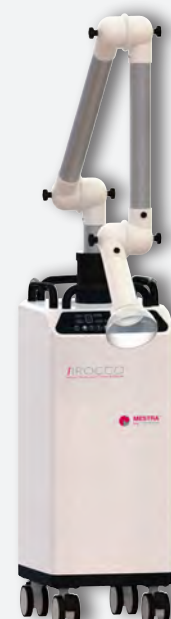
Sirocco L con brazo articulado REF. 080537C (filtro desechable grande) REF. 080537F (filtro reutilizable 7.5 l)