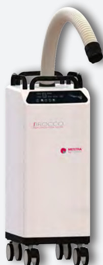
Sirocco L con tubo flexible REF. 080537A (filtro desechable grande) REF. 080537D (filtro reutilizable 7.5 l)