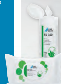
FD 350 Toallitas para desinfección