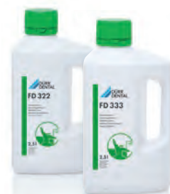
FD 322 o FD 333 Desinfección rápida de superficies

La gama de productos azul es la forma más segura con la que se puede garantizar la limpieza y desinfección manual del instrumental sin dañar los materiales. Los aparatos y accesorios adicionales completan el sistema con el circuito de higiene.