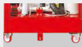
RUOTE DI MOVIMENTAZIONE LOCKABLE WHEELS ROULETTES RÄDER RUEDAS

ASPIRATORE TURBO-SMART VERSIONE B - MOTORE: POTENZA ASSORBITA 1,8 KW - CORRENTE ASSORBITA 7,5 A. PREVALENZA MASSIMA PER IL SERVIZIO CONTINUO 210 MBAR - PORTATA MAX. 1700 L/MIN. AC300 - COMPRESSORE A TRE CILINDRI COMPLETO DI ESSICCATORE ARIA MOTORE MONOFASE: POTENZA RESA 1,5 KW - 10,2 A - MOTORE TRIFASE: POTENZA RESA 1,5 KW - 3,7 A SERBATOIO ARIA 45 L - ARIA RESA CON MANDATA A 5 BAR EFFETTIVI 238 N L/MIN. LIVELLO DI PRESSIONE SONORA: 55 DB(A) MISURE IN MM L = 757 P = 607 H = 1936 PESO NETTO 280 KG