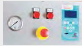
PANNELLO DI CONTROLLO CONTROL PANEL AND DISPLAY PANNEAU DE CONTROLE STEUERTAFEL PANEL DE CONTROL