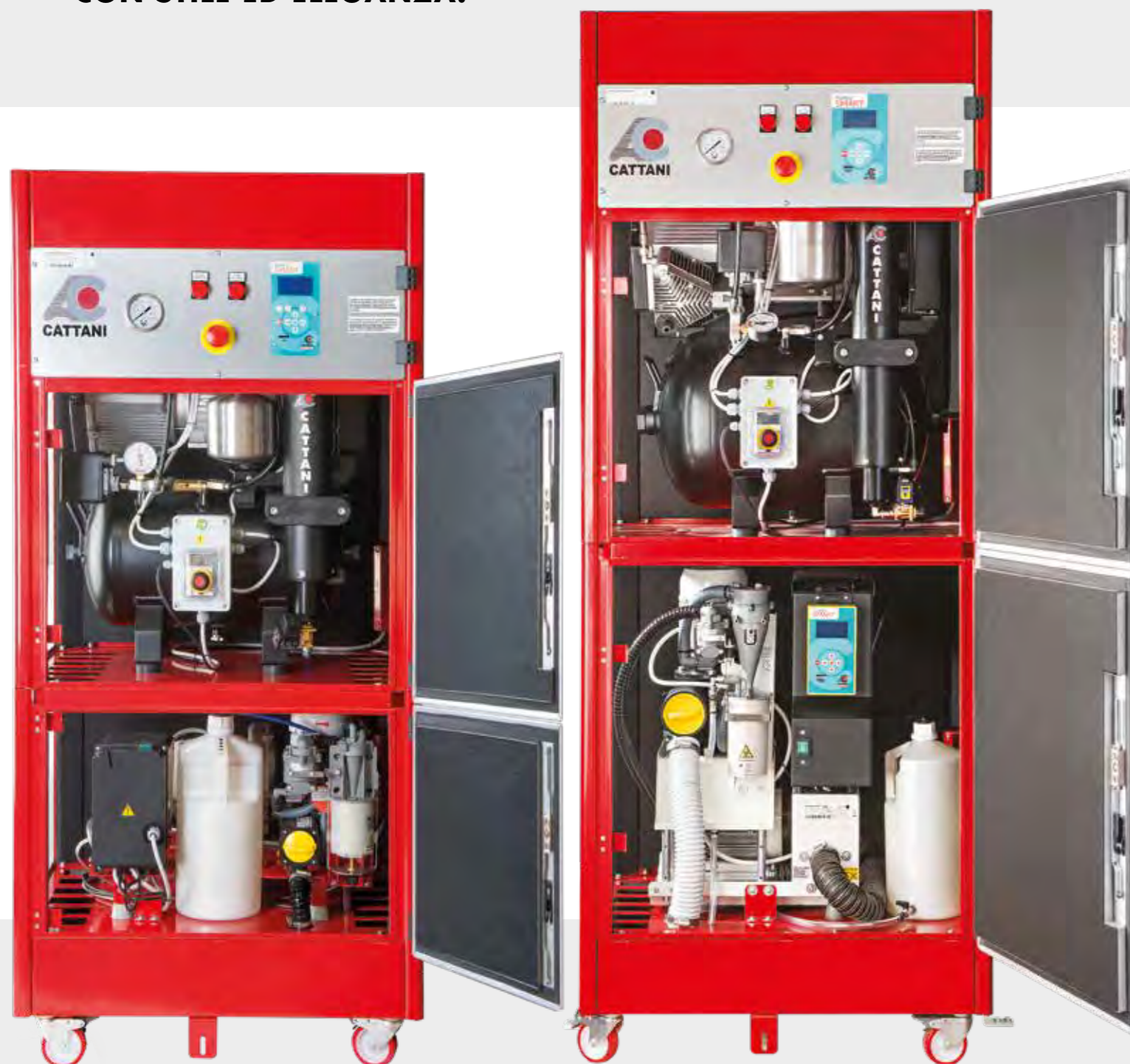
BLOK-JET SILENT 1

GLI ARMADI CHE ARREDANO LO STUDIO DENTISTICO CON STILE ED ELEGANZA.